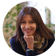
Anne Hidalgo Maire de Paris